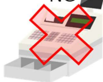
キャッシュレス決済対応レジのみ