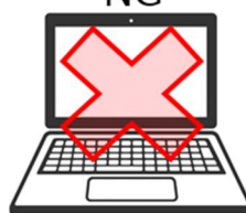
キャッシュレス決済未対応端末（パソコン等）