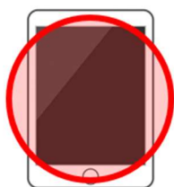
カメラ機能付きタブレット