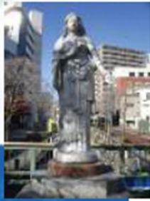
4. 戦災者慰 霊 の女神