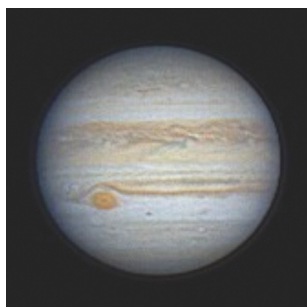
木星 ※2020年撮影

太陽系第5惑星・木星が1月10日に しょう 衝をむかえます。衝とは地球から見て太陽と正反対の方向に惑星が来る時のことをいいます。衝のころは、日の入り後に東の空から昇り、真夜中に南の空を通り、明け方に西の空に沈んでいくので、ほぼ一晩中見え、観察の好機となります。今シーズン、木星はふたご座の方向でマイナス2.7等の明るさで輝いています。