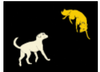
にらみ合う犬とキツネ