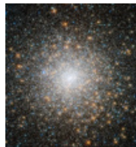
M15 (ペガサス座の球状星団)