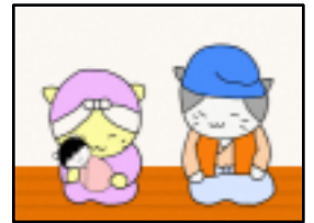
かぐや姫を育てる おじいさんとおばあさん

むかし、竹かごなどを作って暮らしているおじいさんとおばあさんがいました。ある日、おじいさんが竹林に行くと光る竹を見つけました。その竹を切ると、中には女の子が座っていました。おじいさんとおばあさんは女の子をかぐや姫と名付け、育てることにしたのです。