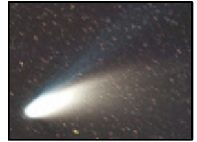
ヘール・ボップ彗星