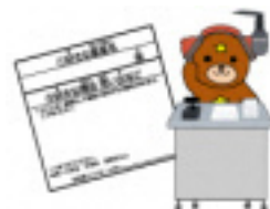
結果発表は クマプラDJが