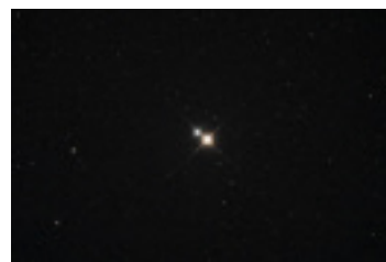
アルビレオ (はくちょう座の二重星)