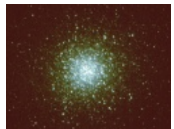
M13 (ヘルクレス座の球状星団)

★定員20人（電話予約制です） 雨天・曇天時は中止となります。 観察する天体は予告無く変わることがあります。 危険防止のため未就学児の参加はご遠慮ください。