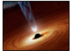
ブラックホールに 落ちるガス