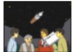
月にまた人が 行くんだよ！