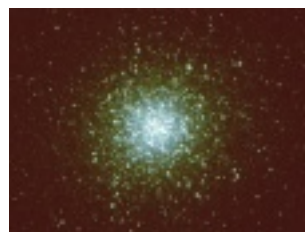
M13 (ヘルクレス座の球状星団) ※画像：国立天文台