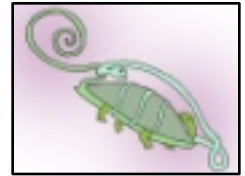
キトラの天文図 「北方玄武」