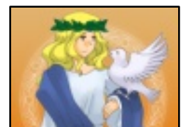
「アポロンのからす」 より