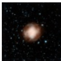
NGC 4361