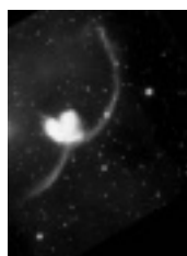
アンテナ銀河