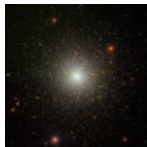
M3 (りょうけん座の球状星団)