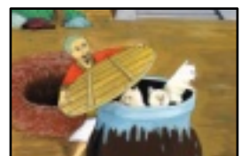
「北豚七星物語」より