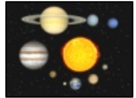
太陽系の天体たち

今日は超高速宇宙船に乗って、まず月、次に太陽、水星、金星と、太陽系の果てまでグランド・ツアーに出かけましょう。