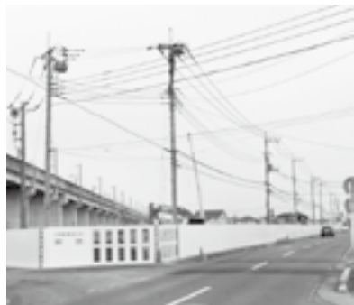
建設工事が進むハイアール予定地(平戸地内)

子ども医療費の中学校卒業までの無料化や、地域子育て支援拠点等の計画的整備を進めてきた。こうした施策により、前期総合振興計画策定時の人口推計を上回る結果となっている。②地域別の人口の増減について分析すると、土地区画整理事業を施行した地区や中心市街地では、5年間で10%程度の人口増の地域がある