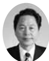
みうらかずお 三浦和一議員 (公明党)