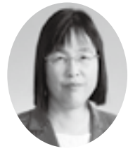
桜井くるみ議員 (日本共産党)