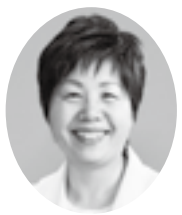
大山美智子議員 (日本共産党)