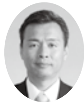
もりや あつし 議員 (公明党)

救急現場活動時、傷病者の状態を正確に判断するための「救急コミュニケーションボード」導入の提案について