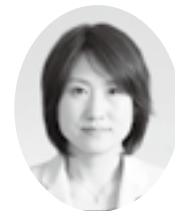
はやし さちこ 議員 (公明党)