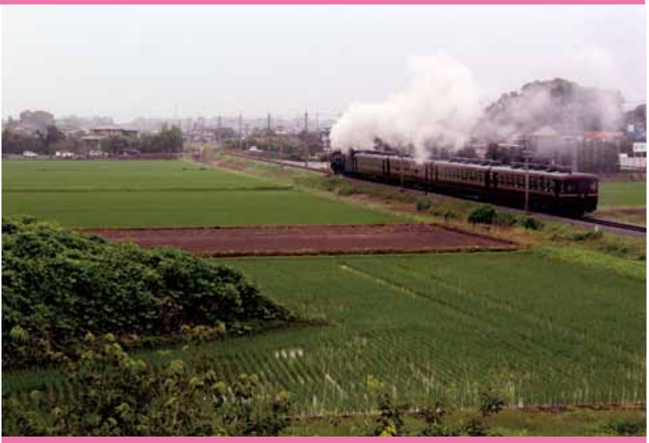
初夏 (第3回くまがや景観写真展応募作品：撮影 森 牧男さん 撮影地 川原明戸)

問い合わせ 熊谷市議会事務局 〒360-8601埼玉県熊谷市宮町二丁目47番地1 ☎048-524-1573(直通) E-mail gikaijimukyoku@city.kumagaya.lg.jp http://www.city.kumagaya.lg.jp/shigikai/