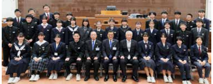
議場の演壇前で記念撮影

令和5年11月14日の県民の日に「第18回 夢・未来 熊谷ジュニア議会」を開催しました。市内の16中学校から選ばれたジュニア議員32人が、市政に関して質問を行いました。中学生ならではの鋭い視点に基づく質問に対し、市長をはじめ、副市長、教育長、担当部長が答弁しました。