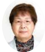
おおやま みちこ 大山美智子議員 (日本共産党)

答 令和6年1月1日以降の無料化の継続については、新型コロナウイルス感染症の感染症法上の位置付けが、季節性インフルエンザ等と同じ「5類」に移行したが、現在の食費等の物価高騰による影響を考慮し、引き続き令和6年12月31日まで市税等の滞納者に対して、助成の対象とすることを検討する。(こども課)