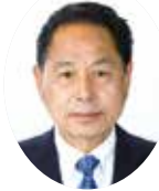
みうらかずいち 三浦和一議員 (公明党)