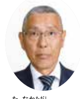
たなかたかし 田中正議員 (熊谷清風会・維新)