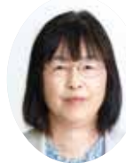
さくらい くるみ議員 桜井くるみ議員 (日本共産党)

答 都道府県選挙管理委員会が指定する「不在者投票施設」で希望すればできる。市内の不在者投票施設は、病院が14カ所、高齢者施設が18カ所、障害者施設が2カ所、その他2カ所、計36カ所ある。また、入院、入所中の施設が、「不在者投票施設」に該当しない場合は、「郵便等による不在者投票」の制度がある。ただし、身体障害者手帳か戦傷病者手帳を持っている方で一定の要件に該当する方や、介護保険の要介護状態区分が「要介護5」の方が利用可能な制度である。 (選挙管理委員会事務局)