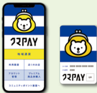
「電子地域通貨」 スマートフォンタイプ(左) カードタイプ(右)のイメージ

商工費 では、11月から発行予定のプレミアム付電子地域通貨について、国の「地方創生臨時交付金」を活用し、当初の発行額5億円から10億円に倍増するための経費を追加することで、市民の消費喚起と電子地域通貨の普及を図り、市内経済の活性化につなげていくものである。