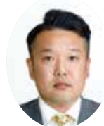
しらねよしのり 白根佳典議員 (日本共産党)