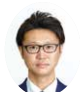
ちば よしひろ 千葉義浩議員 (熊谷清風会・維新)