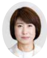
はやしち りつこ 林幸子議員 (公明党)