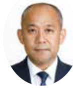
えだだいすけ 江田大助議員 (公明党)