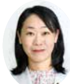
こしづかなほこ 腰塚菜穂子議員 (会派に属さない議員)