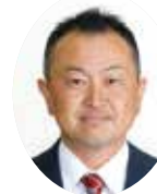
たなかじゅんいち 田中純一議員 (熊谷清風会・維新)