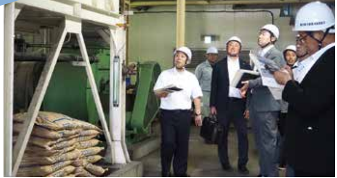
第一水光園で職員の説明を受ける様子

5月17日、初当選議員の研修として、水道庁舎、くまびあ、消防本部、各行政センター等の市有施設を視察しました。