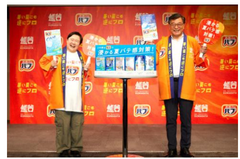
花王株式会社 バブ (クマガヤサポーター)