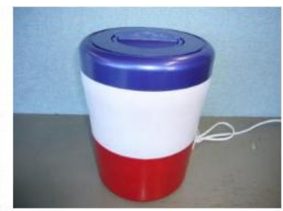
電気式生ごみ処理機

※生ごみ処理容器については、上記の屋外設置タイプの他にバケツタイプのももあります。