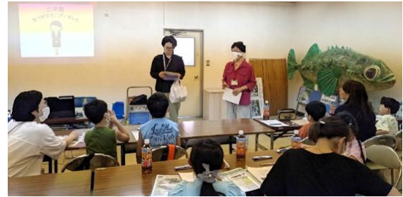
啓発活動の様子 (写真は令和5年度のもの)