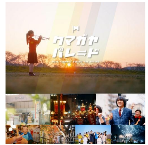
シティプロモーション動画