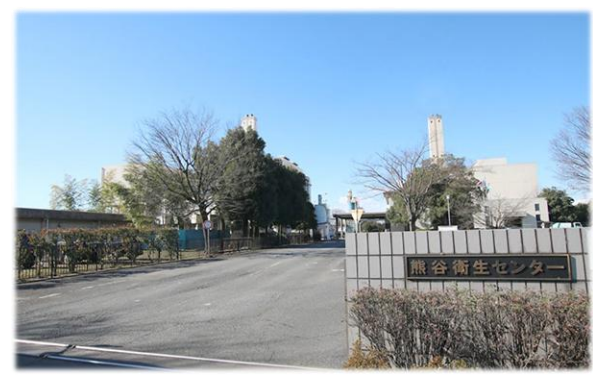
現熊谷衛生センター