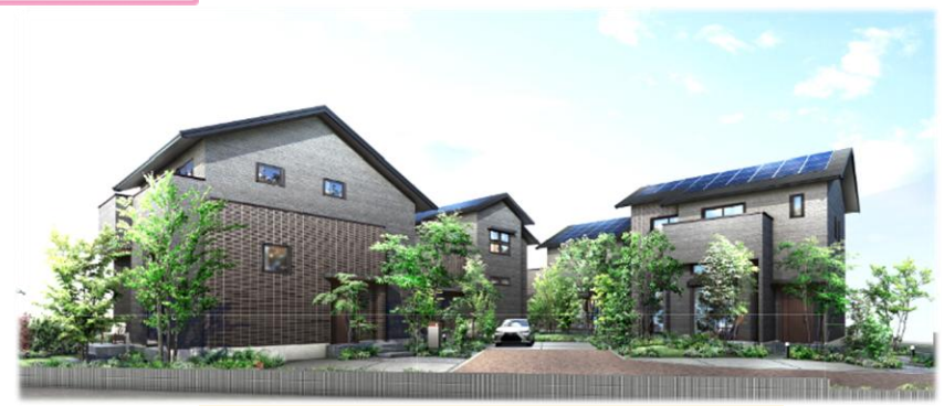
「桜町スマートハウス」 4棟全て販売完了となりました。

実績 交付決定件数 スマートハウス：28件 桜町スマートハウス：4件 (販売完了)