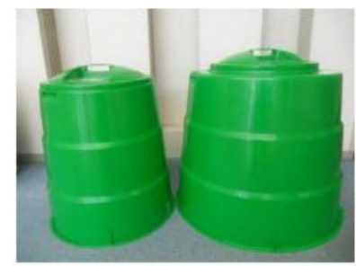
屋外設置タイプ生ごみ処理容器