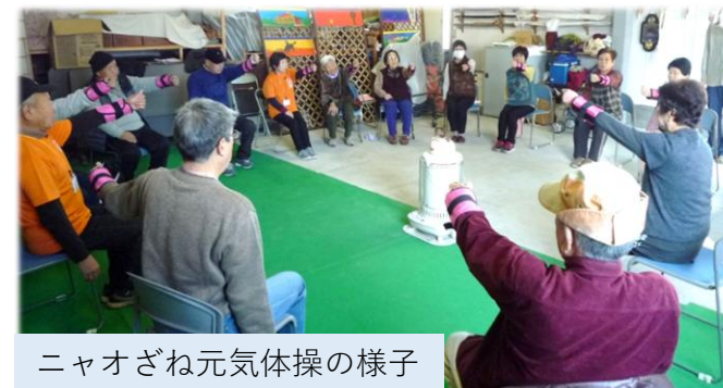
ニャオざね元気体操の様子