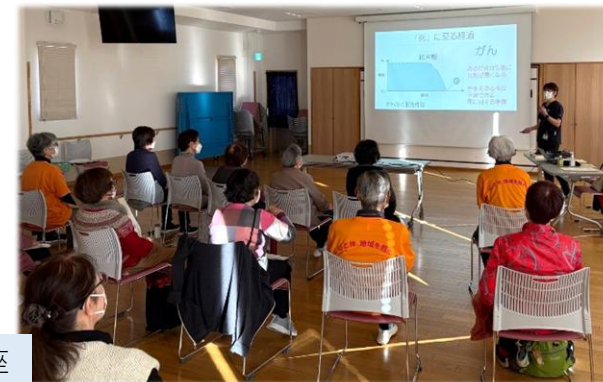
ACP普及啓発出前講座