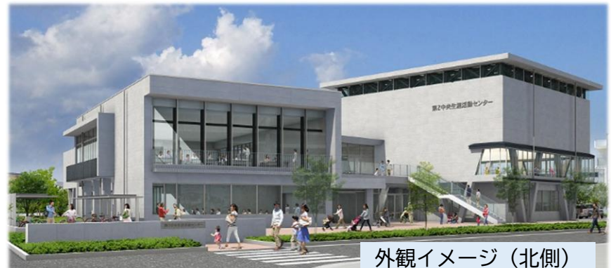
外観イメージ（北側）