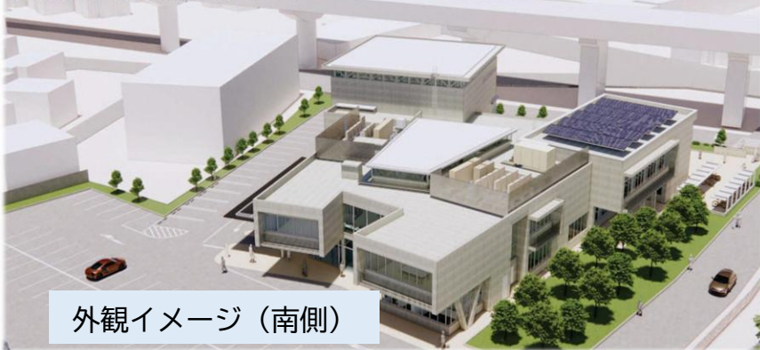
外観イメージ（南側）