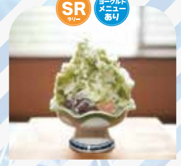
ヘリテイジリゾート 四季の湯温泉