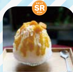
キングアンバサダー ホテル熊谷 サーフ&ターフ