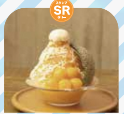
おふるcafé ハレニワの湯