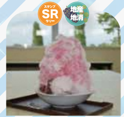
道の駅めぬま サラダ館