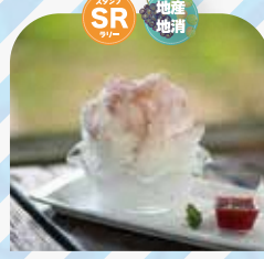
八木牧パークハウス