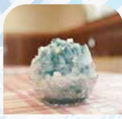
ピッツァ プリマヴェーラ