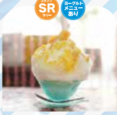
バックパッカーズ ランチ