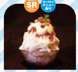
PUBLIC SWEETS TART&PIE