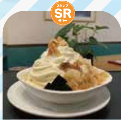
レストラン珈水亭 アズ店