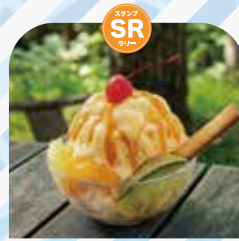
さわた おひさまパン工房