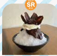
星川空港 Hoshikawa FLY