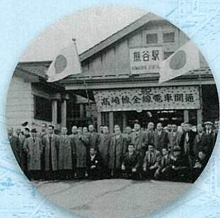
1956(昭和31)年 熊谷駅 高崎線全線電車開通