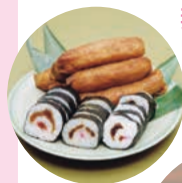
妻沼のいなり寿司