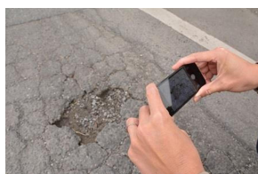
コメントを入力し、不具合箇所を撮影後、送信