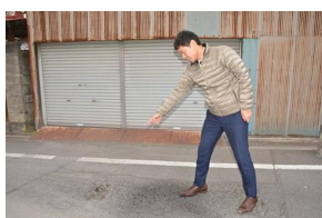
不具合箇所を発見