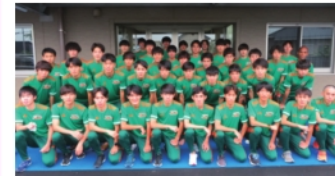
大東文化大学陸上競技部

【現在】引退後の現在は、世界の舞台上で戦ってきた豊富な経験を生かして、ランニングイベントの講師や、小中学生の陸上教室などを行っています。また、野菜ソムリエやアスリートフードマイスター資格を取得し、「スポーツ×食事×健康」をテーマに企業向けの講演活動も行っています。