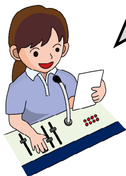
児童から感謝を込めて