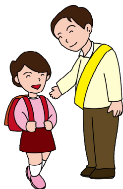
P T Aの協力

こちらは、防災くまがやです。 市民のみなさん、いつも私たちを温かく見守っていただき、ありがとうございます。 小・中学生のみなさん、交通事故に気をつけて登校しましょう。 担当は、 小学校 児童会でした。 こちらは、防災くまがやです。