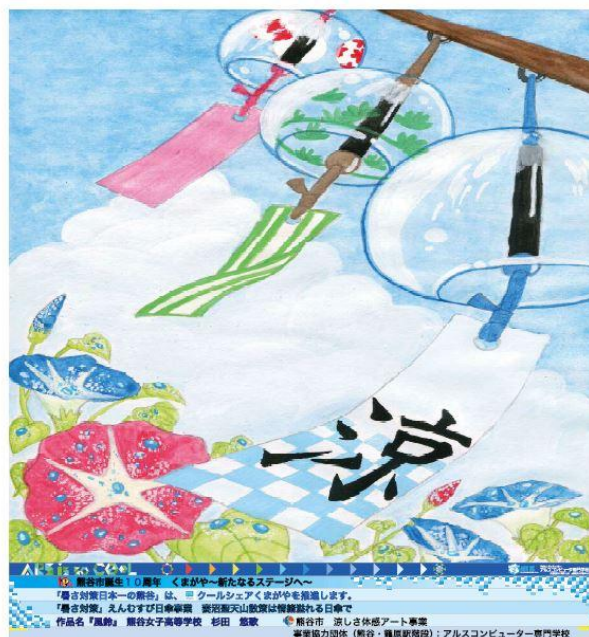
熊谷駅南口 H140×W6400 mm 43段(表示面 49段 H6850×W6400 mm)