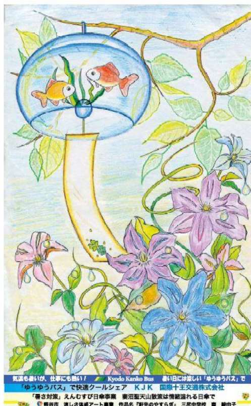
籠原駅南口・東 H140×W3825 mm 41段(表示面 45段 H6260×W3825 mm)