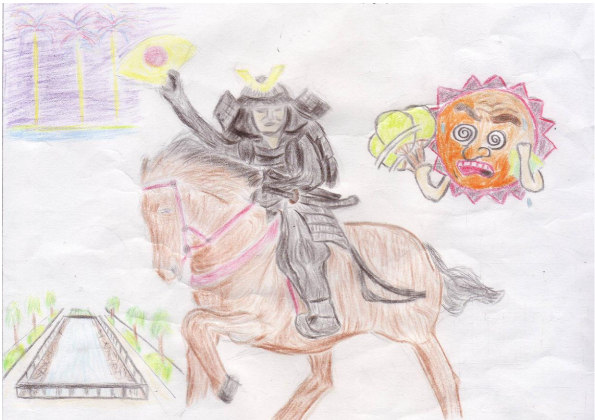
直実号のイラスト（原画）