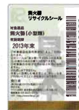
既製品用シール(見本)