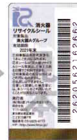
新品用シール(見本)

製品にはリサイクルシールが貼られています。耐用年数を過ぎたら、取扱い窓口へ引き渡してください。