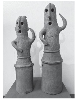
「踊る埴輪」 複製：江南文化財センター蔵