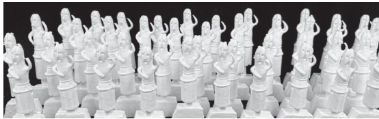
「踊る埴輪」のフィギュア

この事業では、「踊る埴輪」のことを詳しく説明するリーフレットの作成や講座での解説、ホームページ『熊谷デジタルミュージアム』での情報発信のほか、夏休みや県民の日に江南文化財センターで、埴輪づくりや「踊る埴輪」のフィギュアの作成・色付け体験イベントを開催しています。