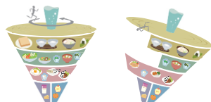
バランスの良い例 バランスの悪い例

食事バランスガイドとは、1日に「何を」「どれだけ」食べたらよいか分かる食事量の目安です。「主食」「副菜」「主菜」「牛乳・乳製品」「果物」の5グループの料理や食品を組み合わせるとるよう、コマに例えてそれぞれの適量をイラストでわかりやすく示しています。