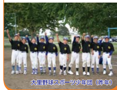
大里野球スポーツ少年団(昨年)