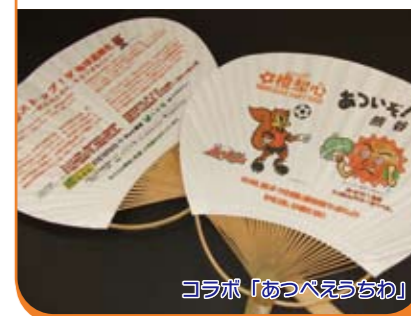
コラボ「あつべえうちわ」