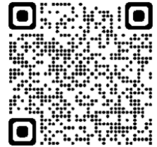
熊谷市電子申請・届出サービス QRコード