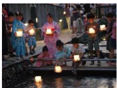
星川とうろう流し