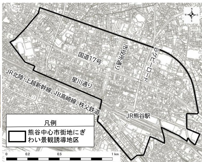
[熊谷中心市街地にぎわい景観誘導地区]

地区内にある様々な資源を生かした、景観まちづくりを進めていきたいと考えています。