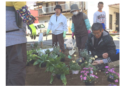
作業開始！バランスを考慮しながら植えていきます。