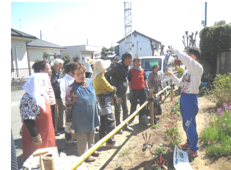
作業の前に、先生の説明や写真を見てイメージを作っていきます。

市としては、今回のワークショップを契機に、庭先や店先空間を花や緑でやさしくつなぎ、通りを行き交う人にうらおいと安らぎを与えるまちへと進んでいければよいと考えておりますので、引き続き、皆様の御理解・御協力をお願いいたします。