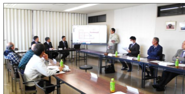
審議会風景(事務局説明)