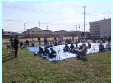
花いっぱいふれあいイベント事業