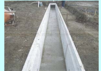
土地区画整理事業(水路整備)

まちの課題の変化 都市基盤施設の整備を進めること、特に排水設備を整備することが課題であったが、従前より冠水の発生していた地域の水路を整備することで、冠水の発生が抑制された。また、都市基盤施設の整備により農地等の宅地化が進み、居住者数の増加がみられた。 交流活動の活発化による、地域住民の交流の輪を広げることが課題であったが、継続的なイベントの開催により、グランドゴルフの団体数及び登録者数の増加がみられた。しかし、グランドゴルフ以外の活動や、地区外も含めた活動の推進が望まれる。また、交流の場として、地域の意向に沿った公園整備が必要である。