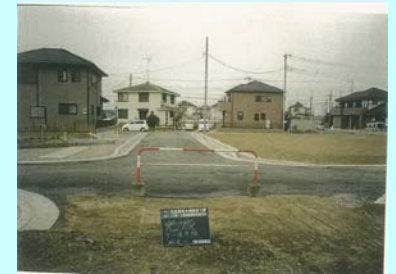
土地区画整理事業(道路整備)