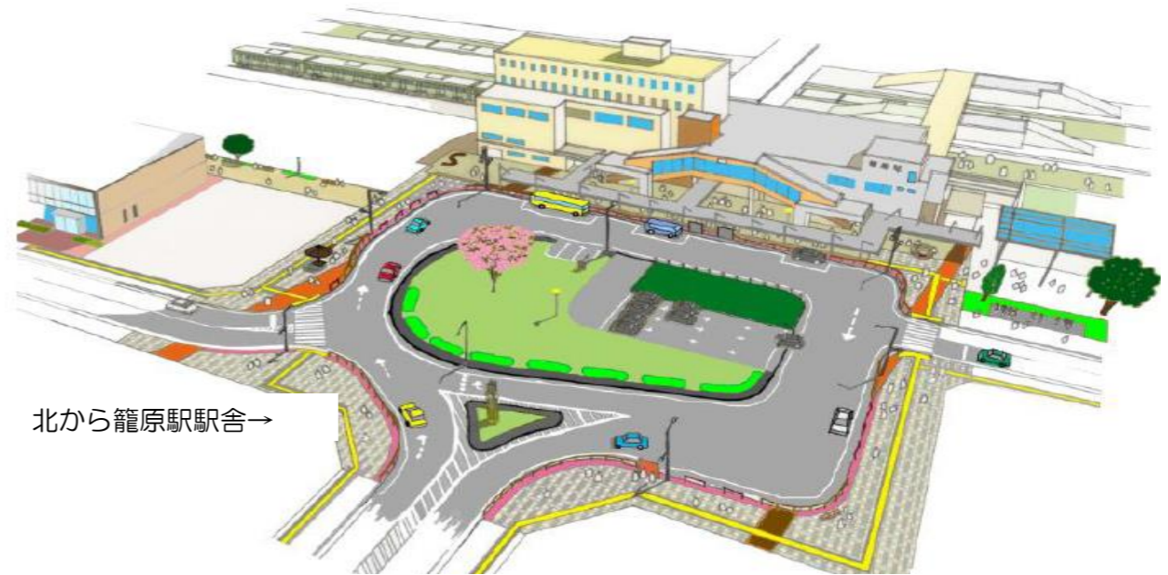
北から籠原駅駅舎→

土地区画整理事業も皆様のご協力により、駅前広場整備を迎える段階へと進んでまいりました。上記の図面については、平成27年度に行ったワークショップ（地元の代表の方や公共交通機関の方を交えた整備計画案の意見交換）により作成したものです。来年度から駅前広場整備工事を行い平成29年、平成30年の2カ年で整備を実施していく予定です。