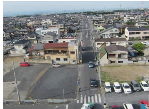
↑ 籠原駅駅舎から北

土地区画整理事業における工事も終盤を迎え、今後の予定も含めまして、駅前広場整備工事の前に、土地区画整理事業についてより理解を深めていただくため、土地区画整理事業の流れと現在の進捗状況のご説明とご報告をいたします。