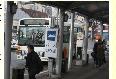
▲熊谷駅南口駅前広場(ゆうゆうバスのりば)