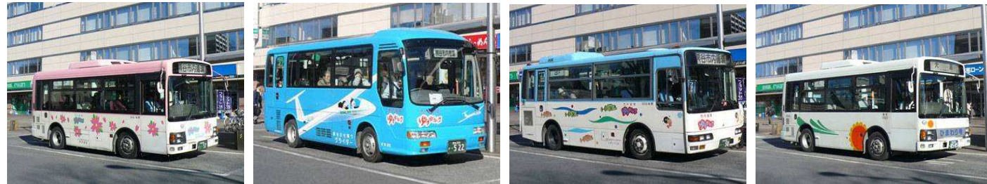
▲さくら号 ▲グライダー号 ▲ムサシトミヨ号 ▲ひまわり号