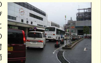
▲朝時間帯の熊谷駅北口駅前広場

公共交通利用者を増加させるためには、過度な自家用車利用から公共交通への転換を促進するための市民の意識改革が必要である。このため、公共交通マップの配布や、運行情報提供の充実などを行うとともに、地域のまちづくりと連携した公共交通利用促進イベント（バス試乗会など）の開催など、公共交通の利用を高めるための施策を展開する。さらに、高齢社会の進行や環境問題への対応など、公共交通の役割が重要性を増している中で、環境負荷の小さいバス車両の導入などについても研究を進める。