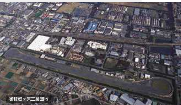
御稜ヶ原工業団地

工業・商業・農業ともに県内で5位以内に入るバランスのとれた産業都市です。企業が集積した工業団地や工業集積地が多数存在し、高度な技術力を有する多彩な企業が活躍しています。