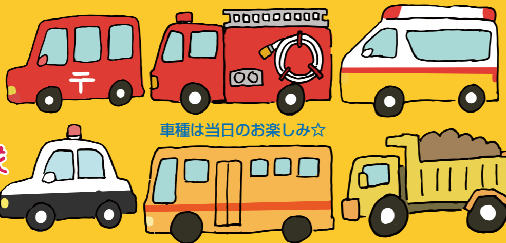
車種は当日のお楽しみ☆