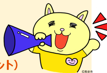
熊谷市マスコットキャラクター 「ニャおざね」