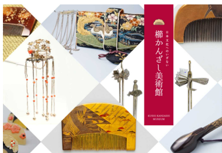
櫛かんざし美術館