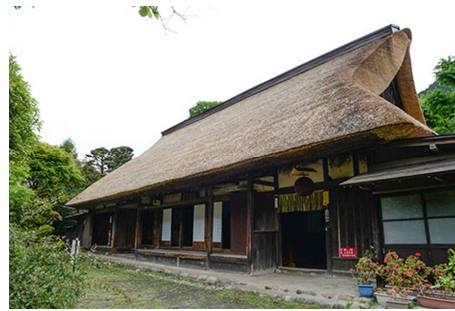
福島家住宅（普段非公開）