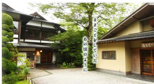
ままごと屋で少し豪華にゆったりと昼食