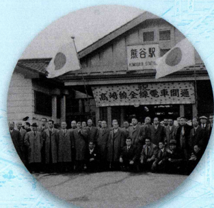
1956(昭和31)年 熊谷駅 高崎線全線電車開通