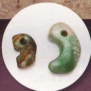
飯塚遺跡 ヒスイ勾玉 (弥生時代)