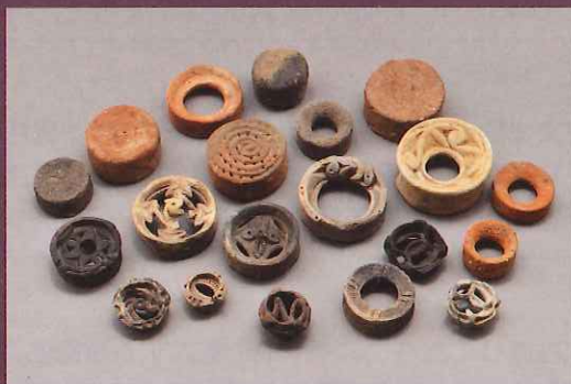
諏訪木遺跡 土製耳飾 (縄文時代)