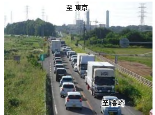
【国道17号西別府交差点付近の状況】 (深谷バイパス)

西別府 にしべつぶ ～東方局所 ひがしがた 渋滞対策は、上下線において付加車線等を整備することで交通を整流化し、渋滞抑制を図る局所渋滞対策事業。