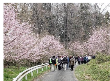
春の里山ウォーキング