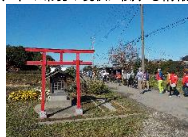
秋の里山ウォーキング