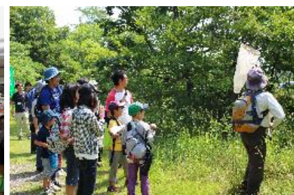
荒川大麻生公園会場