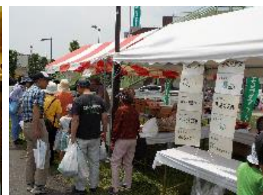
コミュニティひろば会場