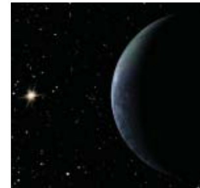
はるかなる新天体