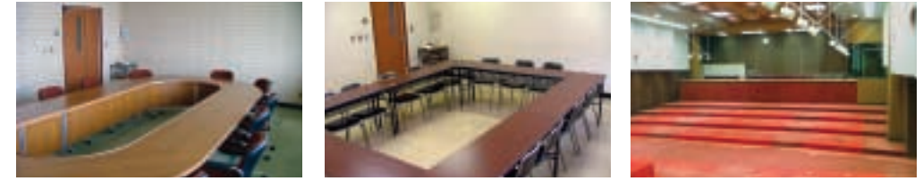
305会議室 306会議室 ホール