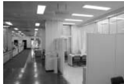
情報公開コーナー

人情報保護制度を実施しています。この2つの制度の平成18年度の実施状況がまとまりましたので、次のとおり公表します。なお、情報公開制度・個人情報保護制度の実施状況報告書が市役所1階の情報公開コーナーにありますのでご覧ください。庶務課 ☎内線223