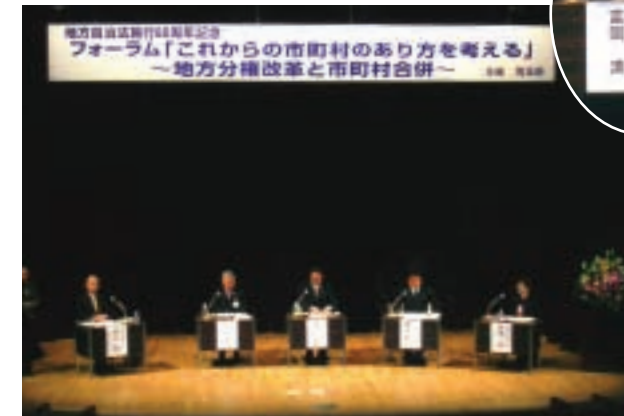
1月27日 地方自治法施行60周年記念 フォーラム

妻沼中央公民館を発着点に開催されました。当日は天候にも恵まれ、市内外から合計186チーム、約1,000人の選手たちが集い、力走をみせました。