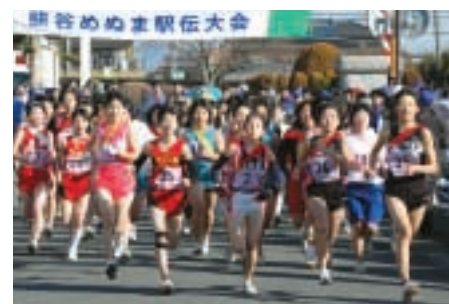
1月26日 第21回熊谷めぬま駅伝大会

妻沼中央公民館を発着点に開催されました。当日は天候にも恵まれ、市内外から合計186チーム、約1,000人の選手たちが集い、力走をみせました。