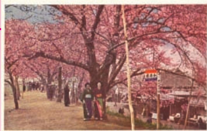
旧桜堤(大正末~昭和初期に発行された絵八ガキ)

定されました(昭和33年に新堤ができ、この旧桜堤はその後崩されましたが、現在では万平公園にその面影を見ることができません。