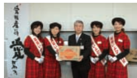
1月31日 いよかん大使

埼玉会館で開催された「これからの市町村のあり方を考える」と題したフォーラムに、富岡市長が県内70市町村長の代表パネリストとして、合併の経緯および合併後のまちづくりについて熱く語りました。