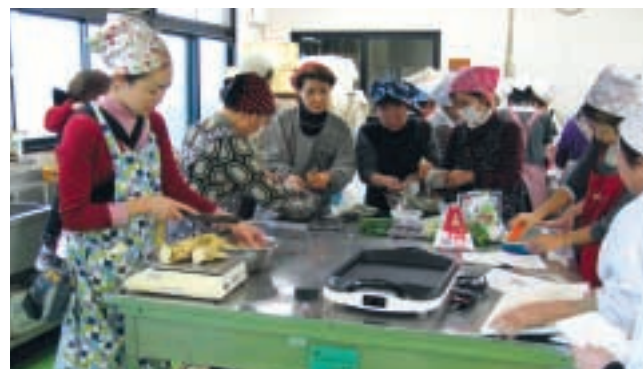
1月31日 やまといも料理教室

妻沼展示館大展示室で、市内特別支援学級と近隣の特別支援学校に通う児童・生徒の作品が一堂に会する展示会が行われました。