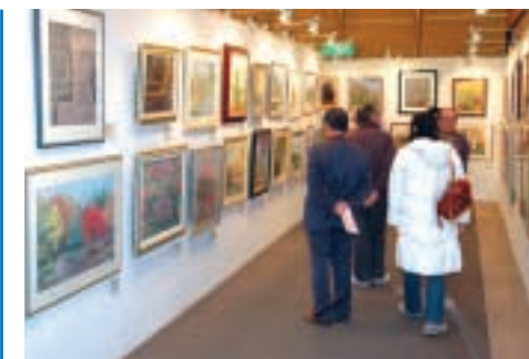
1月24日～28日 第33回 公募 熊谷市勤労者文化展

市役所1階ホールにマン島レースを激走したサイドカーが展示され、2日間で延べ750人が訪れました。普段見ることのない迫力の車体に、訪れた人々からは感嘆の声が上がっていました。