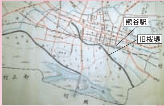
旧桜堤が記載された熊谷全図(昭和2~7年頃)