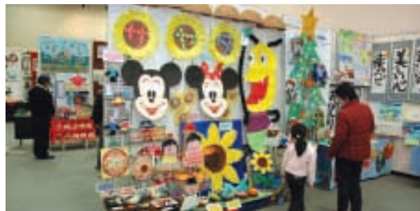
2月1日～7日 夢いっぱいアート展

妻沼展示館大展示室で、市内特別支援学級と近隣の特別支援学校に通う児童・生徒の作品が一堂に会する展示会が行われました。