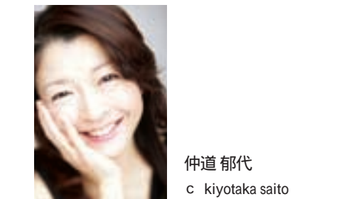
仲道 郁代 c kiyotaka saito