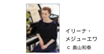
イリーナ・ メジュエワ

月のホール Pコード 272-447 とき 3月23日(日)15:30開演 料金 全席自由 前売券3,000円 当日券3,500円 曲目 ショパン/ポロネーズ第1 番嬰八短調・ノクターン嬰へ長 調、ラヴェル/水の戯れほか 共演 福島明佳(フルート)