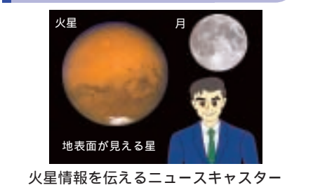
火星情報を伝えるニュースキャスター