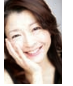
仲道 郁代 c kiyotaka saito