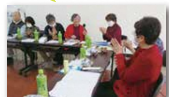
リスナー交流会の様子