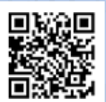
ティアアラ21 ホームページ