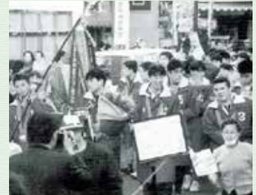
（平成2年2月市報）熊谷工業高校ラグビー部による市内パレードの様子