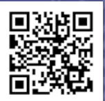
クラウドファンディング 応募サイト

熊谷の夏を彩る「熊谷うちわ祭」を未来へと繋いでいくために、うちわ祭年番町が中心となり、クラウドファンディングを実施しています。 ※詳しくは、下記コードからご確認ください。