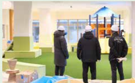
建設中の「くまキッズ」を内覧（左が市長）

これらの育ちゆくプライドを基礎として、「新熊谷ブランドの創造」を進めてまいります。