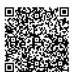
電子申請・届出 サービス